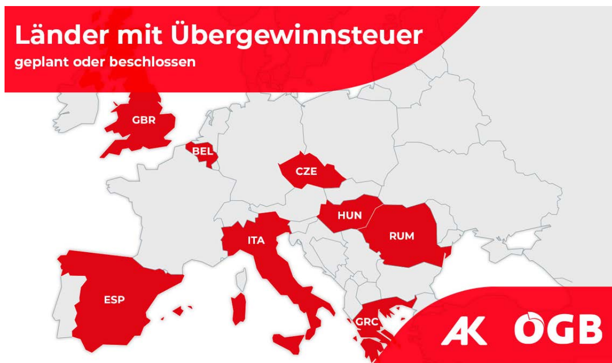
Abbildung 1: Länder mit Übergewinnsteuern

In vielen Ländern Europas wird deshalb schon länger über die Einführung von Übergewinnsteuern im Energiesektor diskutiert. Viele Staaten wie Rumänien, Italien, Spanien, Ungarn oder Großbritannien haben bereits unterschiedliche Modelle der Besteuerung umgesetzt. In weiteren Staaten wie Belgien oder Deutschland finden intensive Debatten statt. Zuletzt hat die tschechische Regierung angekündigt, eine Übergewinnsteuer auf Energiekonzerne einführen zu wollen.